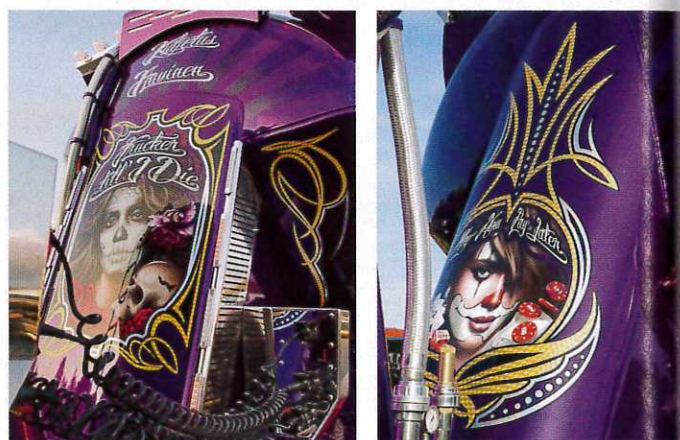
Den amerikanska lowrider-kulturen har inspirerat till Auvinens B-Double-bygge.