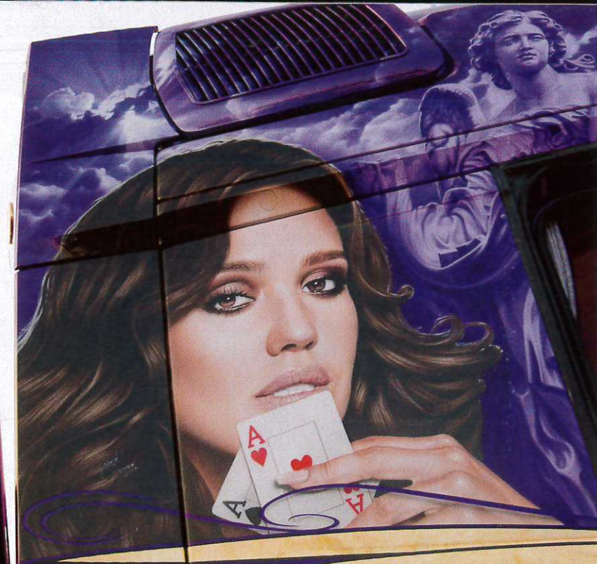
Motiven är nästan som porträtt. På högra sidan, "nöjessidan", är Jessica Alba avbildad med två ess i handen, "Life is a gamble".